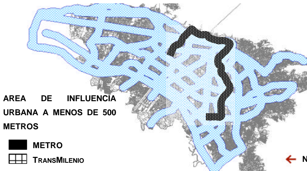
Figura 1. Cubrimiento de los sistemas de transporte.